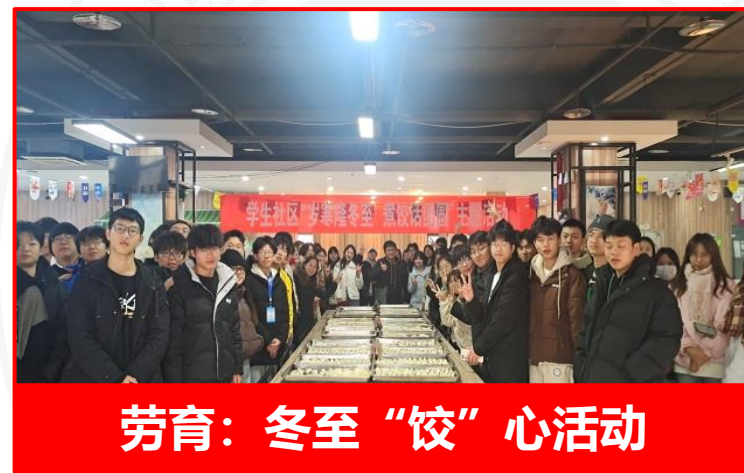
劳育：冬至“饺”心活动