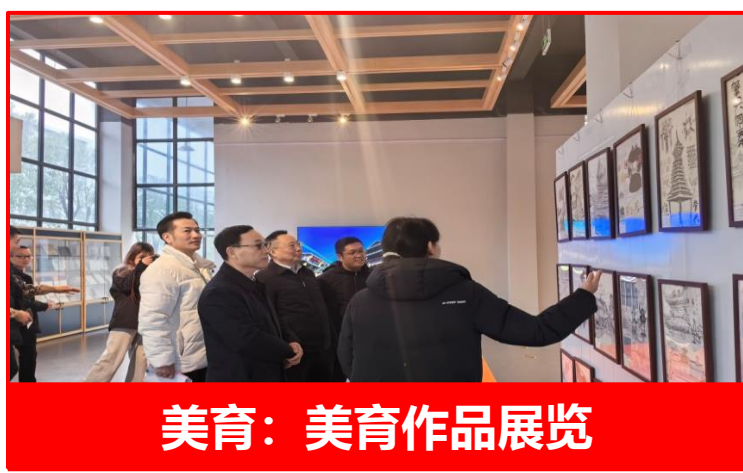
美育：美育作品展览