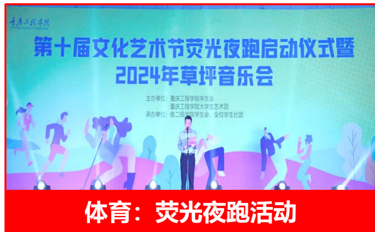
体育：荧光夜跑活动