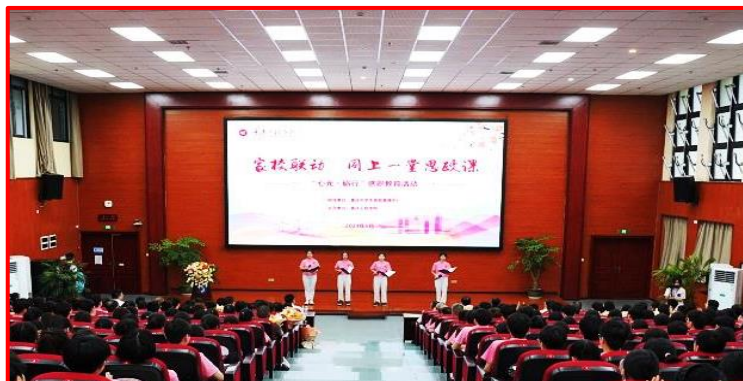
德育：家校联动·同上一堂思政课